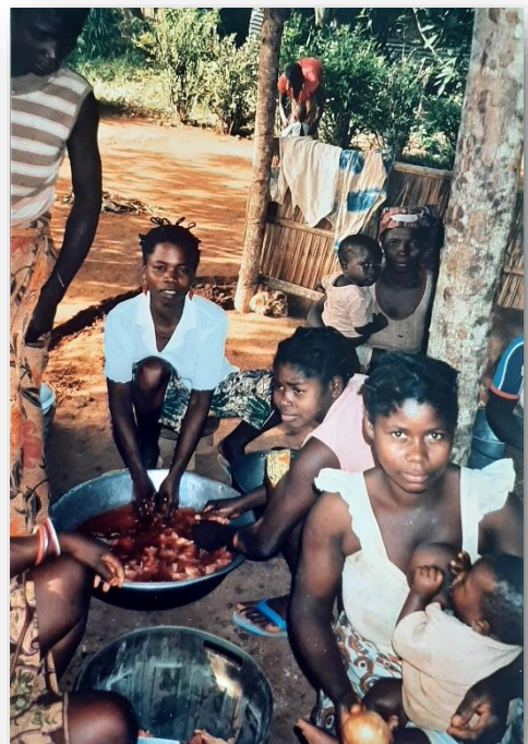
Kameroense vrouwen: altijd aan het werk

In 1986 krijg ik ook een heftige malaria-aanval. Dat heb ik maar niet in een brief naar huis geschreven, mijn familie zou doodongerust zijn geworden. Want ik had thuis in bed aan het infuus gelegen, de