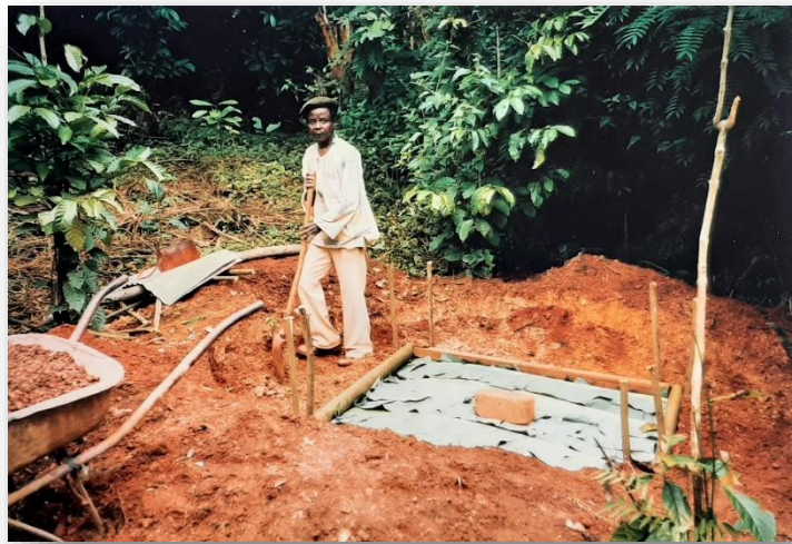
Dorpling, trots op zijn latrine in aanbouw

Nou, die cursus, dat was me wat: georganiseerd in een dorp op 120 km van Batouri. We konden slapen bij de dorpingen en om het leven wat makkelijker te maken, kreeg men van de organisatoren een emmer om je te wassen, 1 kaars als verlichting en 1 rol wc-papier, want dat is in een dorp natuurlijk niet te koop. Ik ben toch maar bij SNV-ers in Bertoua gaan slapen, was toch iets luxueuzer. We begonnen 's morgens om 8 uur en 's avonds om 9 uur was het weer afgelopen. Zelfs op onze vrije dag, 1 mei, was er geen enkel vrij uurtje, dus zijn we er zelf maar tussenuit geknepen om even te gaan zwemmen. Je zou voor de aardigheid de discussies tussen Afrikanen tijdens zo'n cursus eens aan moeten horen (het waren allemaal hoge pieten): er is geen speld tussen te krijgen, iedereen probeert door elkaar heen te praten en ze weten het allemaal beter. In theorie hebben ze alles goed op een rijtje, maar als je ziet wat er in de praktijk van terecht komt, dat is niet te snappen, want ze weten allemaal heel goed wat er moet gebeuren. Op zo'n moment voelen wij, de vrijwilligers, ons volkomen overbodig en dan vraag je je af, of we hier nog wel nodig zijn. Er zijn inmiddels goed