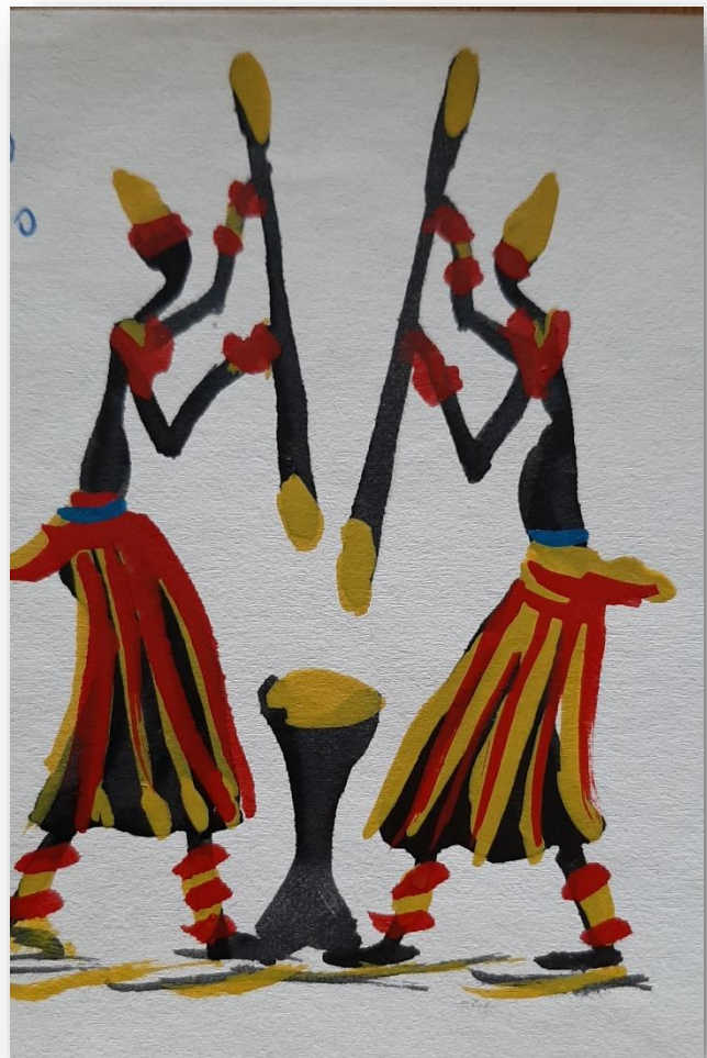
Maniok stampen, ook zwaar werk!

Ria Verbeek © Terug naar Batouri Juli 2021