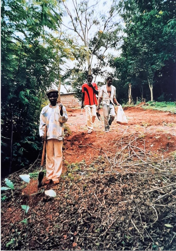
Met schop en houweel aan het werk, latrines bouwen

opgeleide mensen genoeg, maar als het op de uitvoering van het werk aan komt... Veel hangt ook wel af van het gebrek aan middelen. Onze auto's zijn bijna nog belangrijker dan onze eigen inzet. Dat levert heel wat discussies op tussen vrijwilligers over het nut van ontwikkelingswerk en op welk moment je je als organisatie moet terugtrekken. Daar zijn de laatste woorden hier nog niet over gesproken. Het lijkt veel gemakkelijker om in een rampgebied of iets dergelijks te werken, daar is het nut van je inzet veel duidelijker.