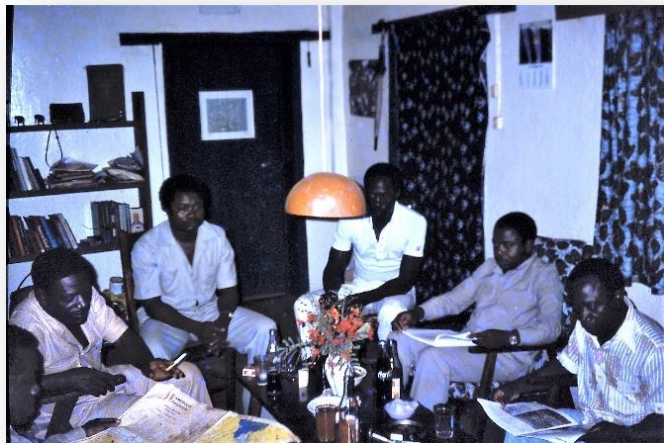
Herenbezoek aan huis

'Dit weekend ben ik op bezoek geweest bij Fransen en Duitsers, die werken voor een Duitse maatschappij die in het oerwoud bomen kapt. Enorme woudreuzen worden omgelegd en per vrachtwagen, men noemt deze een grumier, naar Douala vervoerd. Het is een heel bedrijf daar 'in the middle of nowhere'. Ze wonen er naar Kameroense maatstaven ook ontzettend luxe, met eigen generatoren, videorecorder en airconditioning. Iedere week worden ze per vliegtuig bevoorrad, lekkere happen en films en ook onderdelen voor de auto's. Ze hebben