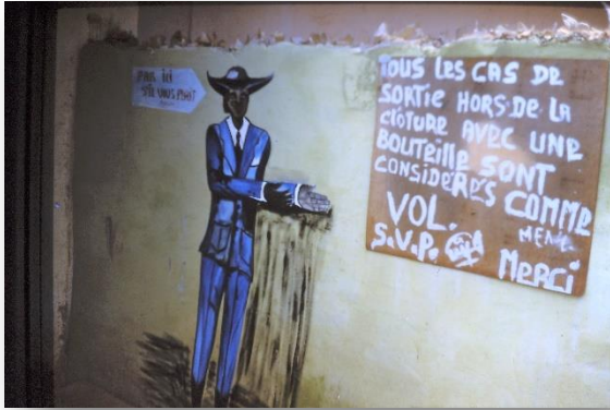
Schilderkunst op de muur van een bar, met een waarschuwing tegen diefstal van flessen drank

wordt vervolgens de weg weer hersteld. Want zonder bier... dat geeft maar onrust in de stad.