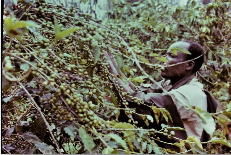
Het oogsten van de koffiebonen

worden al dergelijke projecten opgezet, maar zoals Westlandse tuinders wel weten, brengt het omschakelen van de ene naar de andere teelt, heel wat risico's en problemen met zich mee, zowel financiële, als de benodigde kennis. En de regering op zijn beurt, zou minder geld in het laatje krijgen door minder export.