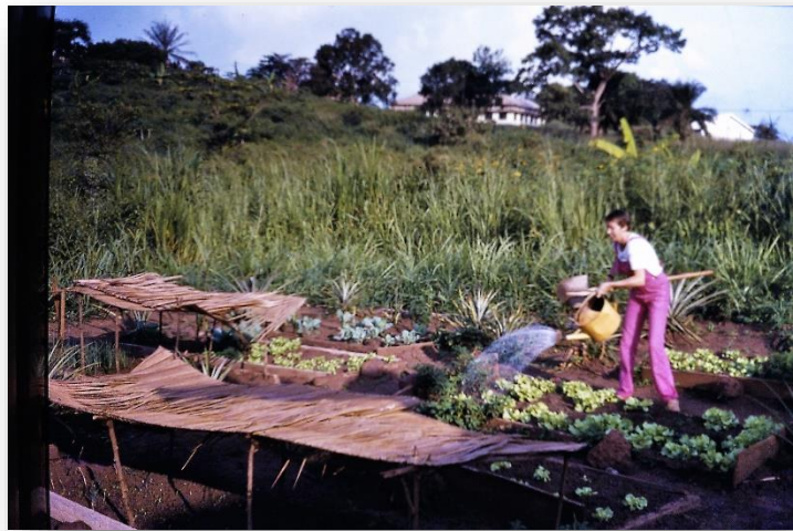
Hard aan het werk in de moestuin

Na 9 maanden op het land gewerkt te hebben keren de mensen terug naar hun dorp met de tabaksoogst, die wordt opgekocht door de Société Camerounaise du Tabac (SCT). De oogst wordt in één keer uitbetaald, zodat men de kans heeft om wat grote aankopen te