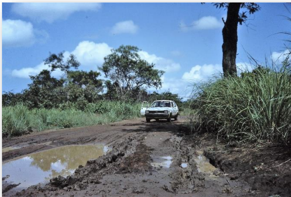
De doorgaande weg...

Ik gaf mijn rondzendbrieven als titel Het Tabaksblad mee, omdat er rondom Batouri veel tabak werd verbouwd. Daar zou ik anno 2021 niet meer mee aan hoeven komen! Want wie nu nog rookt voelt zich regelmatig een paria.