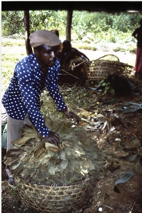
Een tabaksboer levert zijn oogst in bij de SCT

praktezieren wie dat nu ook alweer is, van welke dienst of uit welk dorp. In het begin lijkt iedereen op elkaar en loop je mensen voorbij zonder ze te herkennen. Dat levert weleens pijnlijke situaties op. Elkaar uitgebreid begroeten is hier een vaste gewoonte, waar ik me al snel vertrouwd mee heb gemaakt. Het is één van de uitingen van een rijk sociaal leven, mensen zijn op elkaar betrokken, waarbij familie- en stamverbanden hecht zijn. In de dorpen is het niet het kerngezin (ouders met kinderen) zoals we dat in Nederland kennen, maar neven, nichten, ooms, tantes etc. wonen vaak bijeen in één huis. Families bestaande uit 20 personen of meer, zijn dan ook geen zeldzaamheid. Zit er iemand in moeilijkheden, dan helpt iedereen mee, hetzij financieel, hetzij met hand- en spandiensten, al naar gelang ieders