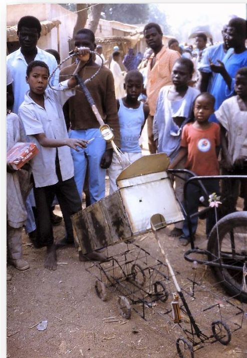
Trots als een pauw is hij, met prachtig, zelfgemaakt speelgoed

Ria Verbeek © Terug naar Batouri Augustus 2021