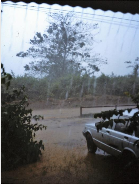
Water uit de hemel, ook een oplossing voor het watertekort...

SNV zorgt goed voor zijn medewerkers, dus voor veilig drinkwater krijg ik een waterfilter, bestaande uit twee delen: in het bovenste gedeelte giet ik het niet geheel ziektekiemvrije water uit de kraan, dat vervolgens via een filtersteen in het onderste reservoir, voorzien van een tapkraantje, loopt. Eenmaal per week de steen uitkoken, en het water is veilig om te drinken.