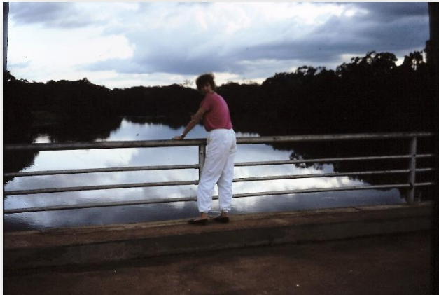
Op één van de weinige bruggen over de Kadey

levensbehoefte. Maar de koloniale machthebbers hadden zo te weinig zicht op de het doen en laten van de bewoners. Daarom werden zij verordonneerd, om zich langs de door Fransen aangelegde wegen te vestigen. Als je geluk had, was er wel een beekje of een bron in de buurt. Maar vaak ook niet.