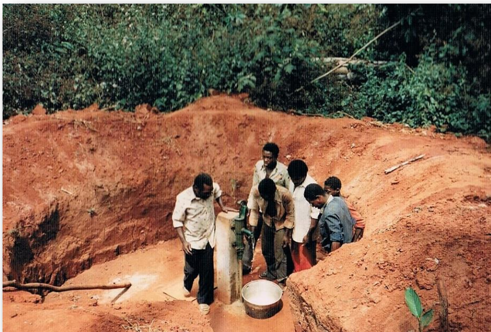
De pas gegraven waterput, voorzien van pomp met zwengel