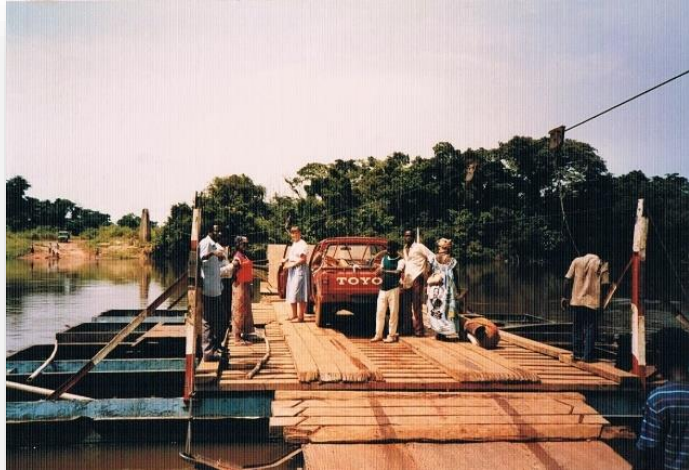
Geen brug, dan maar met de pont naar de overkant

Kameroen wordt doorsneden door vele grote rivieren, zoals ook de Kadey, die zich weer vertakt in allerlei beekjes en stroompjes. Wat