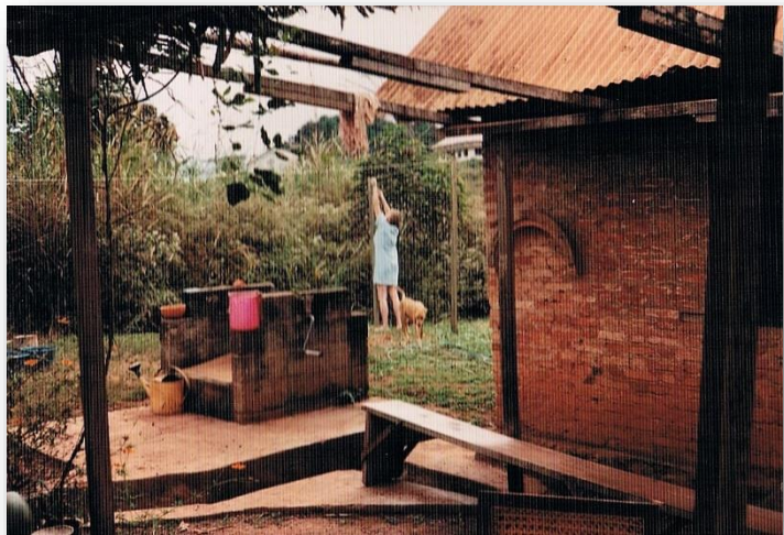
Bij de drooggevallen waterput in mijn achtertuin