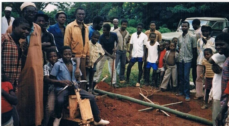
In het dorp Borongué wordt een begin gemaakt met het slaan van een waterput