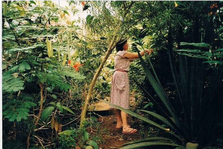
Mijn 'nieuwe' tuin, een oase!

Al die hobbels vallen echter in het niet bij die van de gemiddelde dorpsbewoner als het om schoon (drink)water gaat. Want een waterleiding, een pomp of zelfs maar een put, daar kunnen zij alleen maar van dromen. Vrouwen en kinderen lopen soms kilometers ver met emmers en teilen op het hoofd naar de dichtstbijzijnde bron, waar water