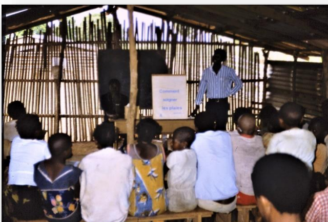
Eerst de theorie: Comment soigner les plaies ...

'Vorige week woonde ik de rapport-uitreiking bij op een lagere school in Batouri. Alle ouders zijn daarbij aanwezig en de directeur spreekt de leerlingen toe. De schoolresultaten in de dorpen zijn vaak bedroevend slecht, veel zittenblijvers en het grootste gedeelte haalt nooit het lagere-schooldiploma. Dit heeft verscheidene oorzaken. Vaak hebben de ouders geen tafel in huis, om huiswerk aan te maken. De school duurt tot wel half 6, dus dat huiswerk moet 's avonds worden gemaakt. En hoe kun je dit doen als er geen geld is voor petroleum