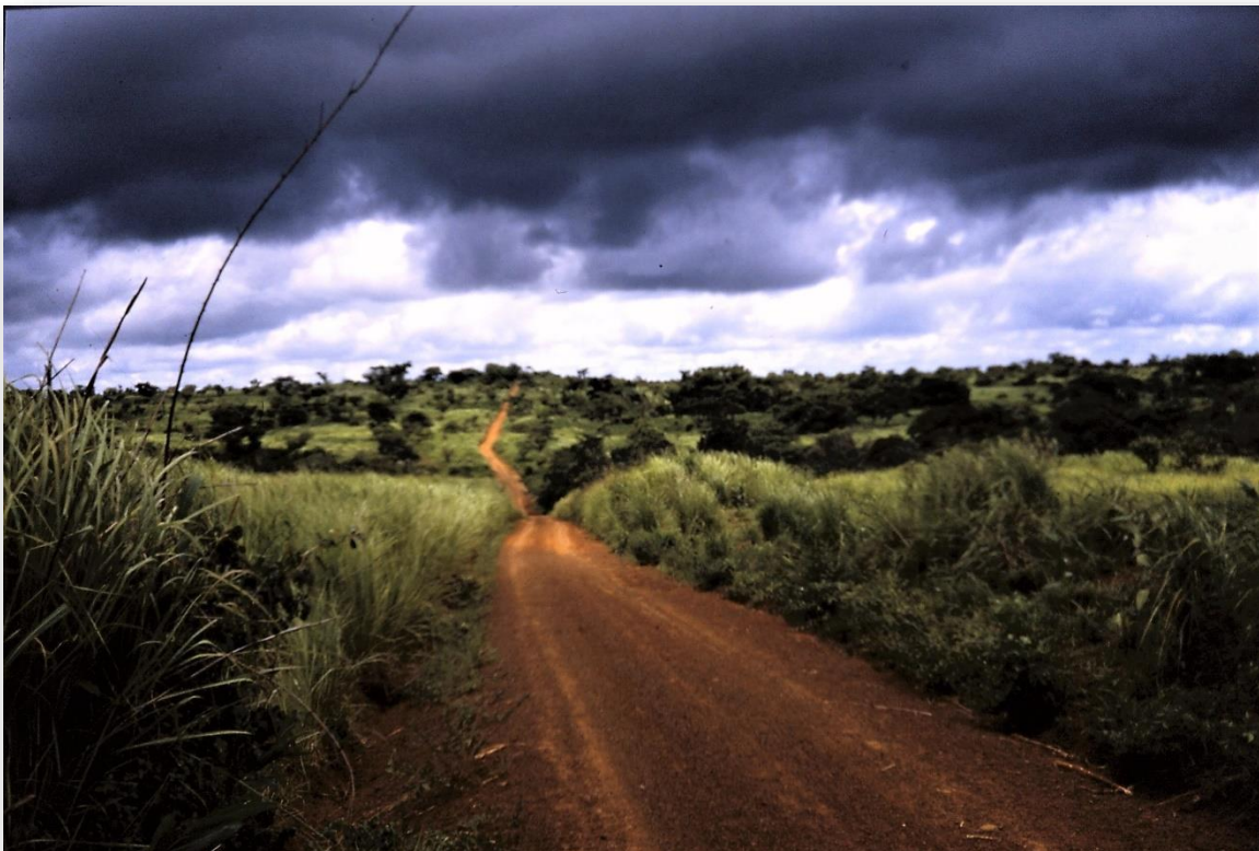
Onderweg naar het dorp Taparé onder dreigende luchten

Ria Verbeek ©Terug naar Batouri Oktober 2020