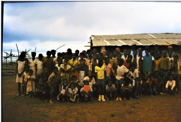
Alle leerlingen even op de foto

Heb je de pech in een dorp zonder school geboren te zijn, dan zit er niets anders op dan 's