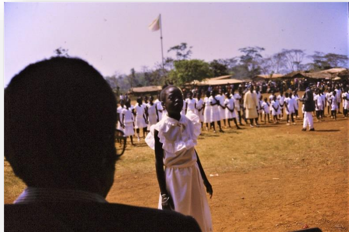
Rapportuitreiking op een school in Batouri

kletsnat. Hoe kun je in die omstandigheden goede resultaten verwachten? Vaak zitten er nog leerlingen van 15-17 jaar op de lagere school, omdat ze steeds met hun ouders naar het