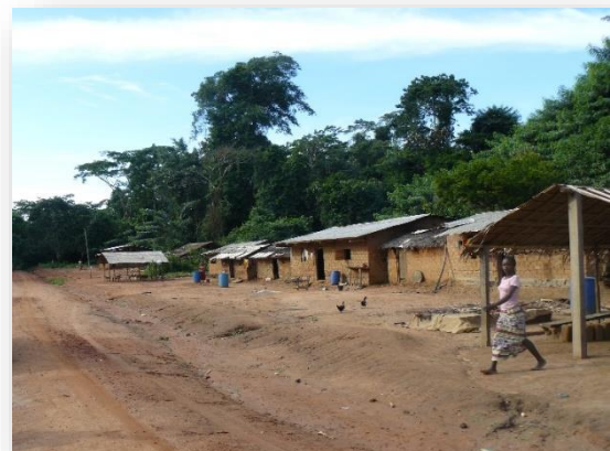
Dorp als lintbebouwing