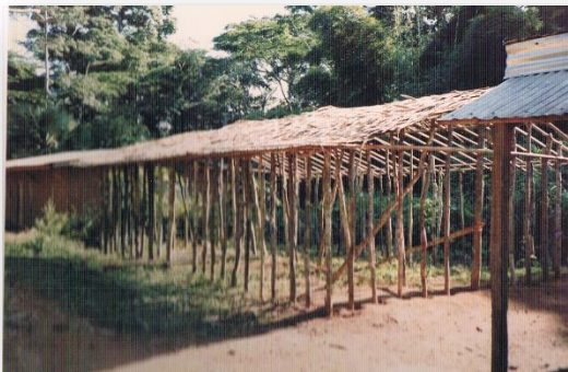
Huis in aanbouw

Ook traditionele vroedvrouwen, dat zijn vaak wat oudere vrouwen, die zonder enige opleiding maar met de nodige praktijkervaring de barende vrouwen in hun dorp terzijde staan, zullen worden geschoold. Meer kennis van eenvoudig prenataal onderzoek of hygiëne rondom de bevalling kan hier een groot verschil maken. Zoals bijvoorbeeld de navelstreng niet langer doorsnijden met een bamboestokje, zoals gebruikelijk is, maar met een scheermesje, dat eerst even door het vuur is gehaald ter sterilisatie. Tetanus, een dodelijke infectie bij pasgeborenen die er nog regelmatig voorkomt, kan daarmee worden voorkomen. Ligt het kind in stuitligging, of is er sprake van een meerlingzwangerschap? Dan krijgen zwangeren het advies om tijdig naar de kraamafdeling van het ziekenhuis in Batouri af te reizen. Hoe eenvoudig kan het zijn? SNV heeft lang gelobbyd om bij dit programma betrokken te worden, en wij grijpen deze kans