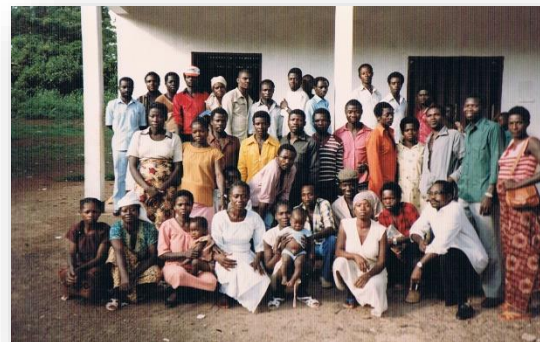
Eerste lichter blotevoetendokters en traditionele vroedvrouwen tijdens de opleiding