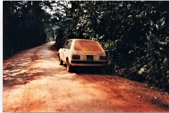
Niets meer te zien door de achterrait!

Mensen in Nederland kijken mij nogal eens meewarig aan als ik vertel dat ik in Batouri personeel had. Inwoners van Batouri daarentegen beschouwden mij als een nogal egoïstisch mens, als ik géén personeel zou inschakelen. Dan hield ik zeker liever al mijn geld in eigen zak, was de veronderstelling. Want ja, er was en is al weinig werkgelegenheid in Kameroen, en een baantje bij een blanke, dat is gewild. Hulp in en om het huis kan ik wel gebruiken, maar ik had helemaal geen ervaring met personeel. En de rol van werkgever, in een vreemd land met andere gewoontes, blijkt in de praktijk geen sinecure. Het takenpakket van de boy (ik heb er verschillende gehad, daarover later meer) bestaat uit het schoonhouden van het huis en het doen van de was, dit alles met de hand. Het voordeel van de tropen is, dat het wasgoed buiten aan de lijn binnen een mum van tijd droog is. Maar direct in de kast, dat is er niet bij. Er vliegen insecten rond, die eitjes leggen in het wasgoed. Alles moet worden gestreken, anders kruipen de larven onder je huid. Dat is mij een keer overkomen en het was bepaald geen pretje, om zo'n dikke witte larve uit je huid verwijderen ... Mijn boy heeft de luxe van een elektrisch strijkijzer, meegebracht uit Nederland. Het