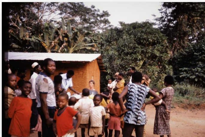
Vaccineren in Dimako I

Het buffet ziet er uit om van te watertanden, met uit Nederland ingevlogen haring, salades, zalm en andere delicatessen die de meeste SNV-ers, meer gewend aan eenvoudig dagelijks voedsel als kookbananen en maniok, al maanden niet hebben geproefd. De eersten scheppen dan ook hun bord lekker vol. Geduldig wachtend in de rij, zien wij de schalen leger en leger worden. We vragen ons af of er niet moet worden aangevuld, maar nee: meer is er niet. Wij als hekkensluiters, zien de heerlijkheden aan ons neus voorbij gaan en moeten genoegen nemen met de restjes! De ambassadeur voelt zich zwaar opgelaten en put zich uit in excuses. Op zulke grote eters had hij niet gerekend, wel een beetje dom als hij zich een beetje op de hoogte had gesteld van wat er dagelijks op het bord ligt van ons, 'broussards'. Hij belooft een herkansing, over enige tijd. Maar ja, om nu 400 km te gaan reizen voor een ingevlogen nieuwe haring... Het is er nooit meer van gekomen. De dag erop prijkt er een grote foto met alle vrijwilligers op de voorpagina van de enige krant die op dat moment in Kameroen verkrijgbaar is en waarvan de pers streng door de regering wordt gecontroleerd: Cameroun Tribune .