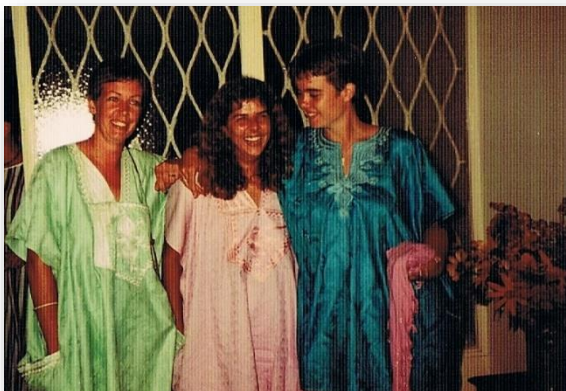
SNV-ers op bezoek bij de ambassadeur

In november 1963 vertrokken de eerste Nederlandse vrijwilligers naar Kameroen om er ontwikkeling te brengen. Dit in navolging van de 'peacecorpers', de vrijwilligers uit de Verenigde Staten. 20 jaar later, het is november 1983 is dat aanleiding voor groot feest. De Nederlandse ambassadeur in Yaoundé nodigt alle SNV-ers die op dat moment in Kameroen werken, uit voor een receptie op de ambassade. Deze wordt opgeluisterd door de nodige hoogwaardigheidsbekleders uit vele buitenlandse landen. Aansluitend is er een koud buffet voor ons, de vrijwilligers. Uit alle hoeken van het land zijn