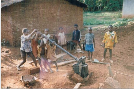
Stenen persen, jong geleerd is oud gedaan

gespannen raakt. Dorpelingen denken dan vaak, dat bouwers zich willen losmaken van de rest van het dorp en dat ze rijk(er) zijn. Dat is niet het geval, alleen wordt hun zuurverdiende geld efficiënter ingezet. Dit soort jaloezie is nogal ondermijnend, en smooft regelmatig nieuwe initiatieven in de kiem. Dit mechanisme is voor ons, westerlingen, onbegrijpelijk. Waar in Nederland het bestellen van een nieuwe badkamer meestal leidt tot meerdere nieuwe badkamers in de straat (vooruitgang!), is dat in Batouri juist het omgekeerde: het wekt jaloezie, wat soms leidt tot beschadiging van mensen en/of hun bezittingen. Dit frustrleert de ontwikkeling van het land nogal en vraagt heel wat stuurmanskunst en geduld van ons, ontwikkelingswerkers.