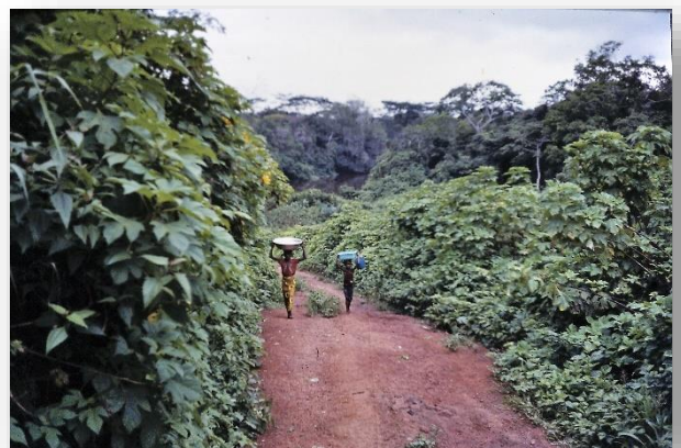
Vrouwen dragen water aan voor het mengen van het leem

vaak wel zo'n vijf jaar, voordat het nieuwe huis klaar is. Ruim vóór het uitbetalen moet Jan de dorpen gaan 'sensibiliseren', oftewel hen warm maken voor het bouwen van een écht huis. Het zuurverdiende geld is anders al snel uitgegeven aan andere zaken, het lijkt wel te branden in de zakken van de boer, die zich één keer per jaar rijk voelt. Verder is het noodzaak, om meerdere boeren per dorp bereid te vinden om tegelijk een huis te gaan bouwen. Het is niet alleen efficiënt, het overdragen van kennis aan meerdere boeren tegelijk, maar het voorkomt ook sociale spanningen. Want het bouwen van een echt huis wil nog wel eens jaloezies geven bij andere dorplingen, waardoor de sfeer in zo'n klein dorp