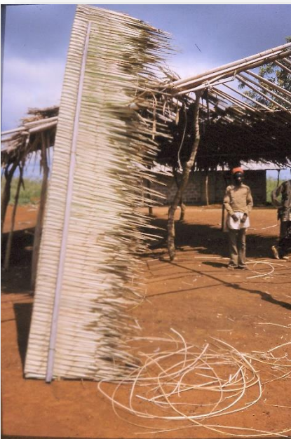
Traditioneel huis in aanbouw, met gevlochten palmladeren voor het dak.