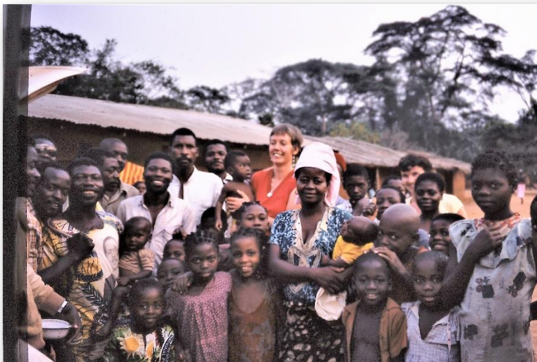
Met het hele dorp op de foto

levende kip aangeboden, kakelend en wel, en een regime bananen. Dat is een stam, waar zo'n vijf enorme kammen aanzitten. Met nog een maaltijd, couscous van maïs en maniok en sardines-saus toe. Ik had m'n fototoestel mee, dus ik heb het halve dorp op de foto gezet. Onbegrijpelijk voor hen, dat in Nederland geen bananen, maniok en pinda's groeien. Ze