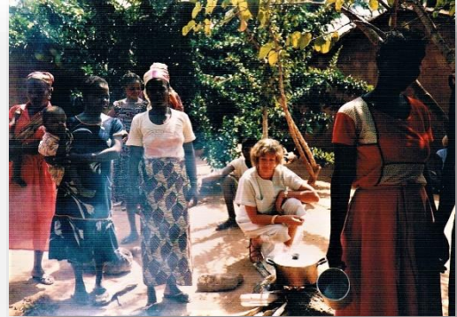
Even toekijken bij het koken van de sojapap op het houtvuur