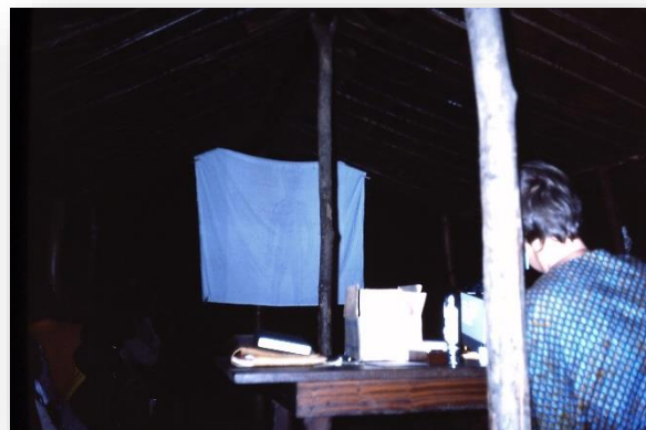
Met een oud laken als projectiescherm

'Vanmorgen overleed er een baby van twee maanden oud tijdens het consultatiebureau. Het kindje was al ver heen, toen het bij ons op de weegschaal lag. Longontsteking, dacht ik zelf. Dorpingen proberen hier eerst hun traditionele geneesmiddelen, zoals bladeren of aarde op de huid leggen, en verder veel touwtjes met leren amuletten, gevuld met bepaalde kruiden of poeders. Deze dragen ze om het buikje, om de arm of om een beentje. Deze baby had dan ook een dikke korst van allerlei mengsels op het hoofdje. Men krast ook wel in de huid met een scherp voorwerp en wrijft er kruiden in. Gaat het dan nog niet beter, pas dan gaan ze naar een eerstehulp post, of naar een ziekenhuis van