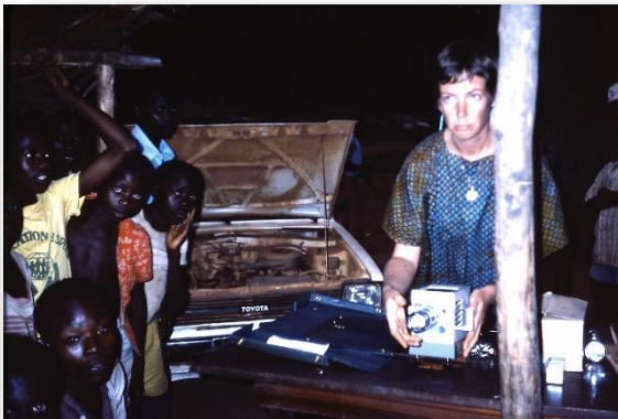
Vorbereiding van een dia-voorstelling in een dorp

Ook in Batouri komt het leven pas weer op gang aan het eind van de middag, zodra de temperatuur wat begint te zakken. Ons ochtendprogramma, een consultatiebureau in een van de dorpen, is dan al achter de rug. In de namiddag gaan we opnieuw op pad, nu om gezondheidsvoorlichting te geven aan mannen en vrouwen in weer een ander dorp. Mijn collega en ik hebben daarbij een grote troef in handen: we beschikken over een dia-projector die werkt op de accu van de auto.